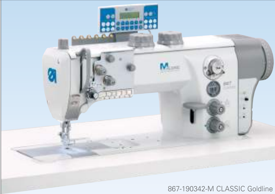
867-190342-M CLASSIC Goldline

Die leistungsstarken Unterklassen / The highly efficient subclasses